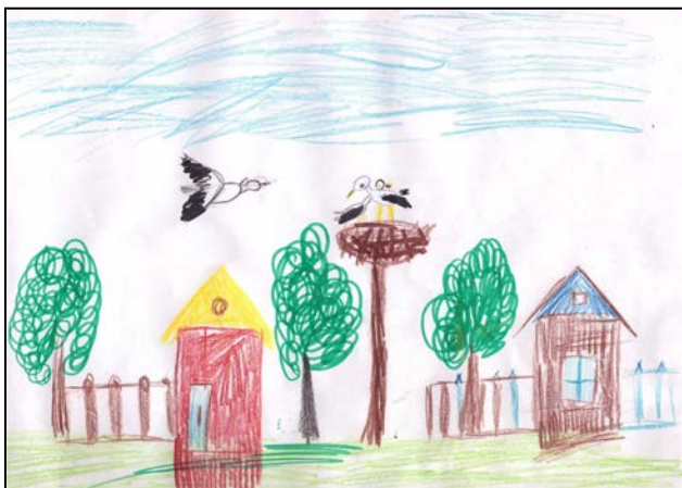
«Гнездо аиста». Исмаилова Айгерим

Ласково солнышком нам улыбнётся, Весело звонкой капелью прольётся! Белым подснежником вдруг прорастёт, Песней соловушки нам пропоёт!