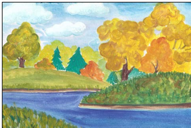
«Осенние облака». Габышева Лиза

Побежит быстрее Синяя река, Приплывут кораблики – Чудо-облака.