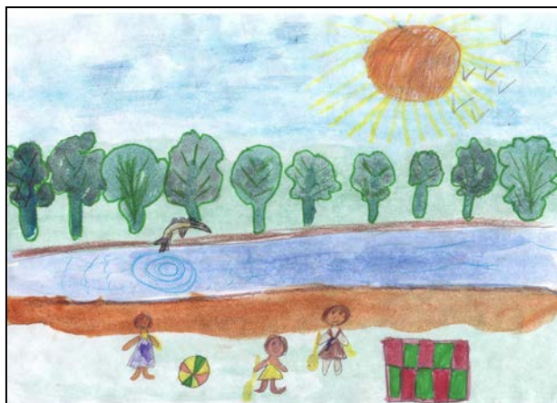
«Девочки на пляже». Домрачева Элеонора

А над водой, а над водой, Куда ни посмотри, А над водой стрекозок рой, Прозрачны и легки.